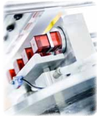
Automatisierte Rundum-Prägung einer rechteckigen Attrappe mit einer Silberglanzfolie.(Eigenkonstruktion)

Über 30 Präge-, Rundpräge- und Tamponprintautomaten stehen für Sie zur Verfügung.