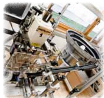
Rundprägemaschine mit automatischer Teilezuführung.