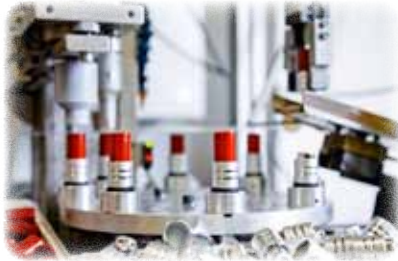
Ultraschallschweiß - Halbautomat

Durch unsere Eigenentwicklung von Montageautomaten und Ultraschweiss-Maschinen fügen wir Kunststoffteile kostengünstig zu einem funktionierenden Ganzen zusammen.