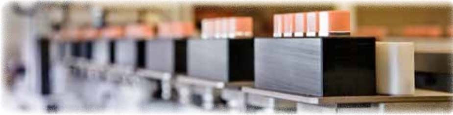
Schnelltaktender Montagetisch - Automat

Durch unsere Eigenentwicklung von Montageautomaten und Ultraschweiss-Maschinen fügen wir Kunststoffteile kostengünstig zu einem funktionierenden Ganzen zusammen.